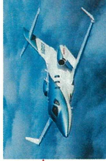
No11,12 ホンダジェットなど(小型)

・No6スポットが、大型のビジネスジェットの駐機場所となります。 ※Aエプロンも、連続駐機可能といたしました。