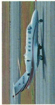
No15 セスナサイテーション など(中型)