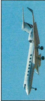
No6 ガルフストリームなど(大型)