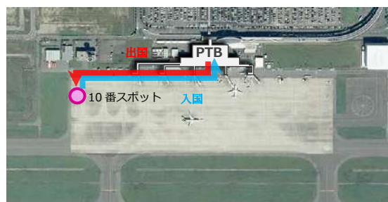
プライベートジェット駐機スポット