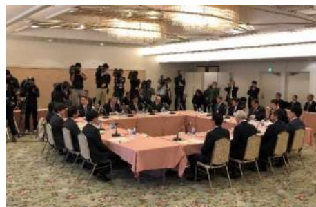
「第9回関西3空港懇談会」の様子

緩和された要件でのプライベートジェット受入に係る運用は、2021年1月1日から開始します。